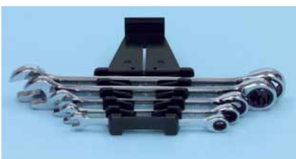
Set de Llaves combinadas Ratchet

El extremo del anillo extremadamente angosto para trabajar en espacios estrechos, ángulo de rotación de 5°, preciso núcleo de anillo para un funcionamiento suave y seguro